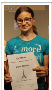
Englisch grüner Jahrgang und Französisch Winnie Mendala